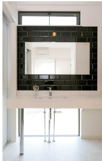
ミラーの周囲をタイル貼りにし、足元にはガラス窓を設けたホテルテイストの洗面化粧台