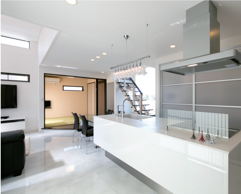
白にシルバーが映えるアイランドキッチン、シャンデリアのようなペンダントライトが美しい。まるでホテルのスイートルームのようなテイストでインテリアデザインを統一し、隣接する和室の入り口には段差をつけた板間も設けて、縁側のように腰掛けられるように工夫