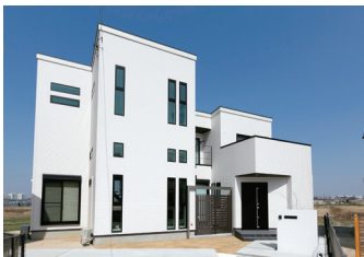
凹凸を生かした外観デザインで個性を演出。やや斜め向きに建てることで採光性も確保