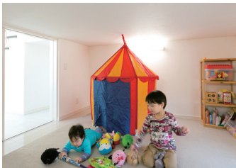
2階スキップフロア下に配した大収納空間は、まだ小さなお子さんの遊び場としても活躍中