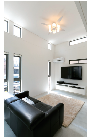
2階にスキップフロアを設けて天井高を確保し、開放感たっぷりの吹き抜けリビングに