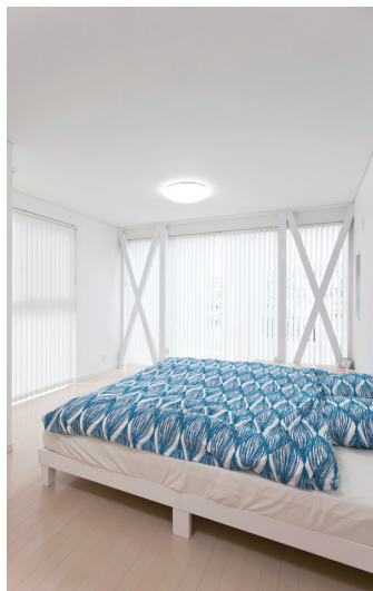
白い壁や天井に囲まれ、二面採光で明るい1階の洋室は、爽やかな気持ちのよい空間