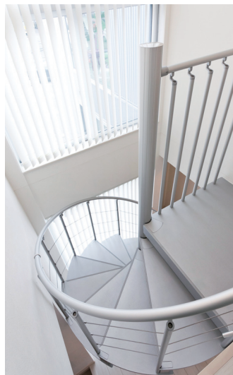
T字型の家のほぼ中央にあるらせん階段。北面に大きな窓を設けることで、採光性豊かに