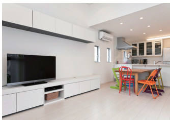
片側の壁に収納力豊富な造作棚を設置。よく使うリビング小物もすぐ出し入れできて便利