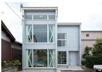
外壁にはガルバリウムを採用し、無機質なデザインに。壁よりも面積の広い窓は圧巻だ