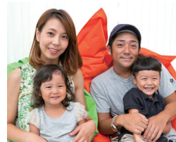
「家を新築して全般的に生活の質が上がりました」とSさんご家族