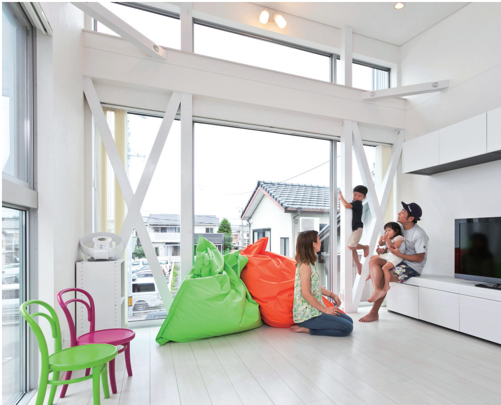
家族が集うLDK、水廻りが2階にあるため、外からの視線を気にせずに家族のくつろぎの時間を楽しめる。開口部が北側でも、二面採光の大きな窓を備えており、室内をひと際明るく照らす。「キッチンに立って、正面に窓の向こうの景色を望めるのが気持ちいいですよ」とSさん