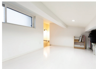
日常使いしないモノをしまっておける小屋裏収納。固定階段で荷物の出し入れもしやすい