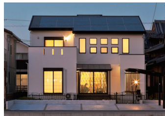
夜景も美しい外観デザイン。ファイネソラーシステムで10kW超の太陽光発電も搭載