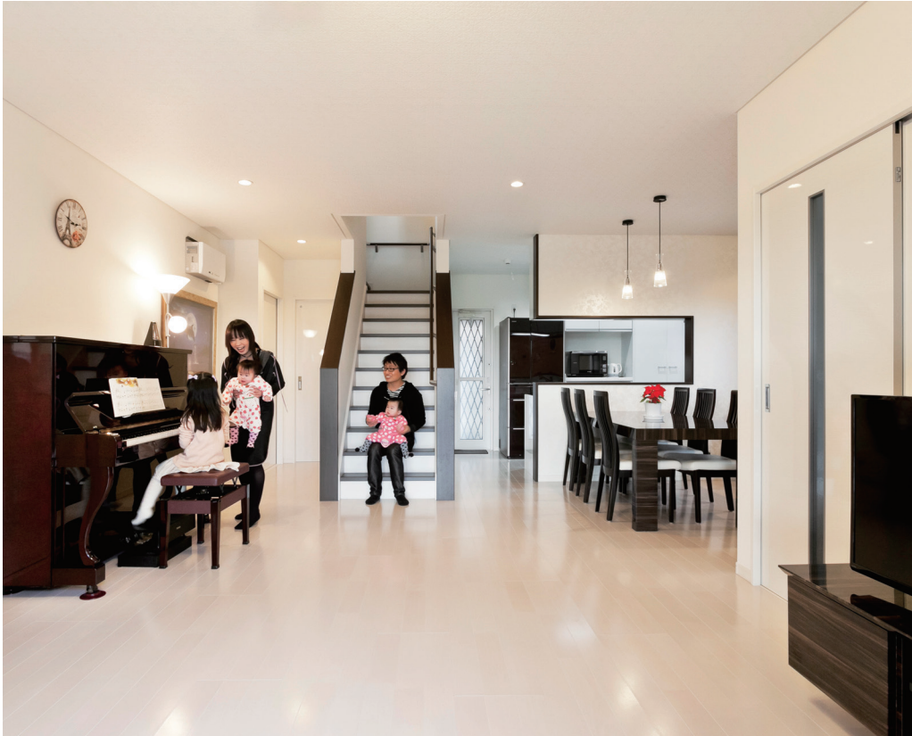
中央にリビング階段を設けたLDKは約22.5帖の広々空間で、壁、床、天井とも白をベースに、ポイントに黒を配したシックなインテリア。室内の雰囲気に合わせてテレビボードも造作、統一感のあるデザインに仕上がった。将来的に両親と暮らすことも考えて1階はオール引き戸に