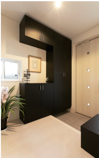
小さな丸窓がお洒落な玄関扉、レザー張りのシューズクロークはOさんのこだわり