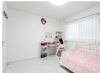
お姫さまルームのように可愛いインテリアの2階子ども部屋。机と壁の棚は造作したもの