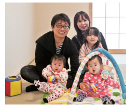
「二世帯仕様で細かい要望も丁寧に対応してくれました」とOさん