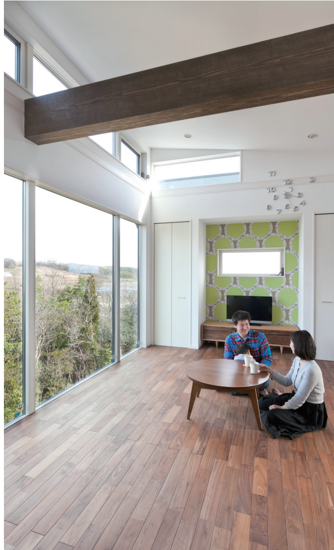
2階にリビングを配し、大きな窓を設けることで、すぐ横の緑あふれる景色がいつでも目の前に広がる。無垢の床の風合いも心地よく、自然の癒しを常に感じていられる心落ち着く空間