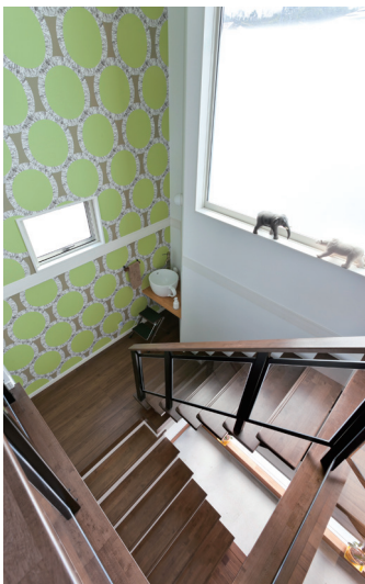
大きな窓を設けた明るい吹き抜けの階段。コーヒーカップ型の洗面とトイレを途中に設置