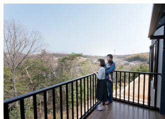
ダイニングや洗面室と繋がる広いバルコニーは、まさに自然と一体となれる場所