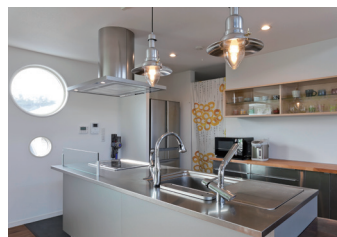
壁の丸窓がアクセントになったアイランドキッチンは、天板が広く家事がしやすく便利