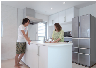
開放感いっぱいのオープンキッチン。天板が広く、パン作りなどでも重宝しているとか