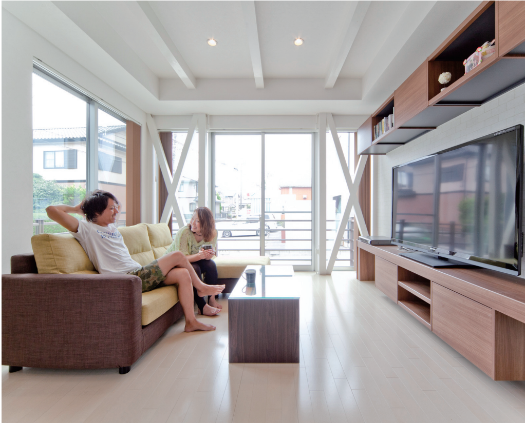
リビングは二面採光で窓も大きく、また壁や床、天井も白をベースにしているため、明るさはひとしお。「光がいっぱい開放感もあるリビングは、とにかく居心地がいいですね。テレビボードとその上の飾り棚を造作してもらい、マガジンラックにもなるニッチも設けてくれました」