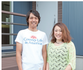
「窓がいっぱい、とにかく明るい家にしたかったのが本当に満足です」とKさんご夫婦