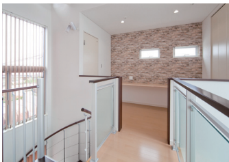
2階ホールにはカウンターを造作し、将来お子さんが勉強するスペースなどに活用