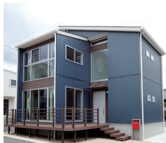
太陽光発電パネルを3.56kW乗せた片流れ屋根に、大きな窓の多いT字型の外観スタイル