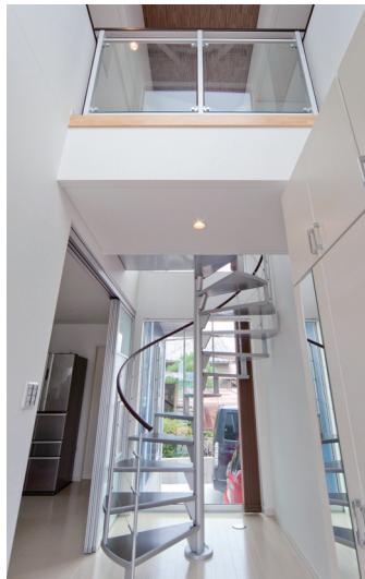
天高6mを超える吹き抜けの玄関は、正面にらせん階段があり来客も驚く個性的なデザイン