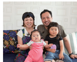
「いろいろと融通をきかせてくれて満足です」と笑顔のIさんご家族