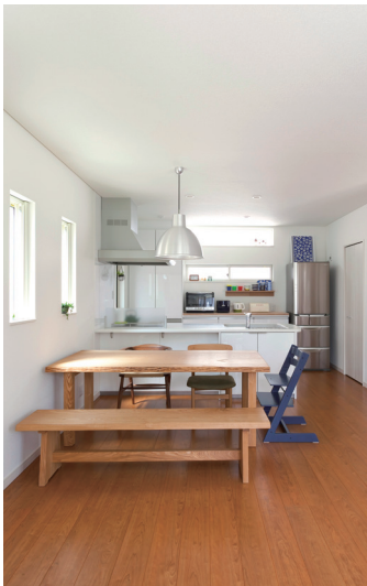
LDK空間が一体に。キッチンで家事をしながらリビングのおさんの様子も見られて安心