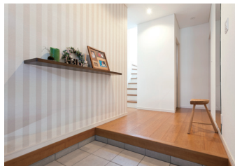
やわらかい風合いのクロスにニッチの飾りが来客をやさしく迎えてくれる玄関ホール