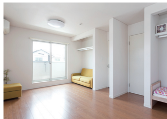
明るい2階子ども部屋は、将来的に間仕切りをつければ2部屋に分けることもできる広さ