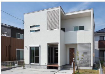
キューブ形の外観スタイル。リビングの一部をインナーテラスのようなウッドデッキに