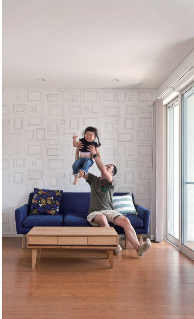
インナーウッドデッキと繋がるリビングの一隅は、遊び心のあるクロスに一面だけ張り替え、奥行き感を演出。窓から射し込む光で明るく、おさんとのふれあいタイムも楽しく過ごせる