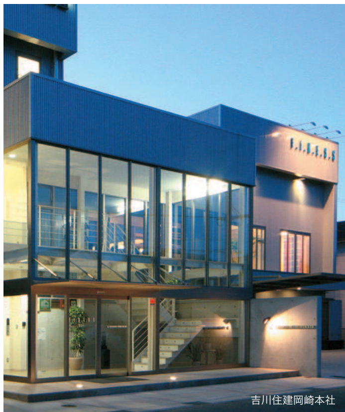
吉川住建岡崎本社

住まいづくりは家族にとって一大プロジェクト。計画から完成までには、話し合い、検討すべきこともたくさんあります。漠然と広がるイメージを具体的なカタチにしていくプロセスは、「ワクワク、ドキドキ」。私たちスタッフと楽しみながら一緒に理想の住まいを実現しましょう。